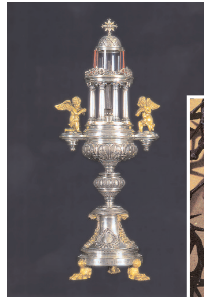
Il reliquiario con il Chiodo. Sotto, le spine della Corona.