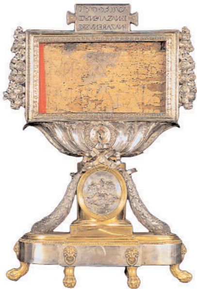
Reliquiario con il Titulus Crucis, scritto in ebraico, greco e latino.

Sant'Ambrogio ce la descrive con grande vita, che cammina tra le rovine dei templi romani accompagnata da soldati e operai. E si domanda: Qui c'è il luogo della battaglia; ma dov'è il trofeo della vittoria? Io sono su un