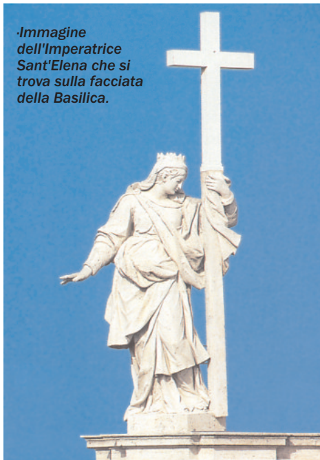
-Immagine dell'Imperatrice Sant'Elena che si trova sulla facciata della Basilica.

sentì una grande avversione per il cristianesimo alla fine della sua vita, ed è quasi sicuro che la costruzione di questi templi avesse il fine di cancellare per sempre le orme terrene della Redenzione.