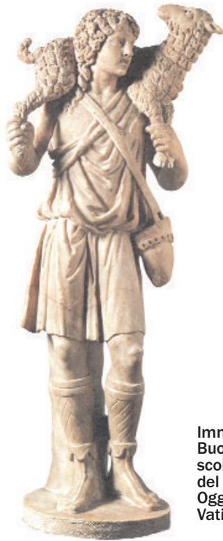
Immagine del Buon Pastore sculpta a metà del IV secolo. Oggi è ai Musei Vaticani.

conoscere le pecore una ad una; a dare la vita per loro, a portarle ai migliori pascoli, a non smettere di curare quella che si era perduta o fermata lungo il cammino 10 .