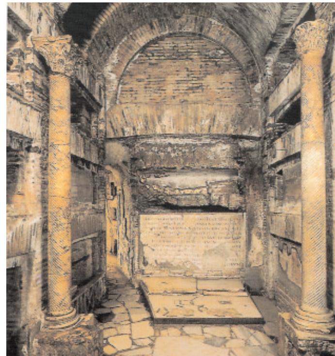
Nella Cripta dei Papi furono sepolti sei romani pontefici del III secolo, e alcuni sacerdoti e diaconi che furono martirizzati insieme al Papa Sisto II. In fondo c'è una lapide che San Damaso collocò nel IV secolo.

Anche se l'interesse per le catacombe rinasce a partire dal XV secolo, bisognerà aspettare fino al XIX perché tornino ad essere valorizzate come luogo santo e tesoro della cristianità. Giovanni Battista De Rossi, fondatore dell'archeologia cristiana moderna e scopritore delle Catacombe di San Callisto, racconta nelle sue memorie come convinse Pio IX a visitare gli scavi. Quando arrivarono alla Cripta dei Papi, De Rossi gli spiegò le iscrizioni e gli mostrò la lapide che San Damaso fece collocare nel IV secolo con i nomi dei successo-