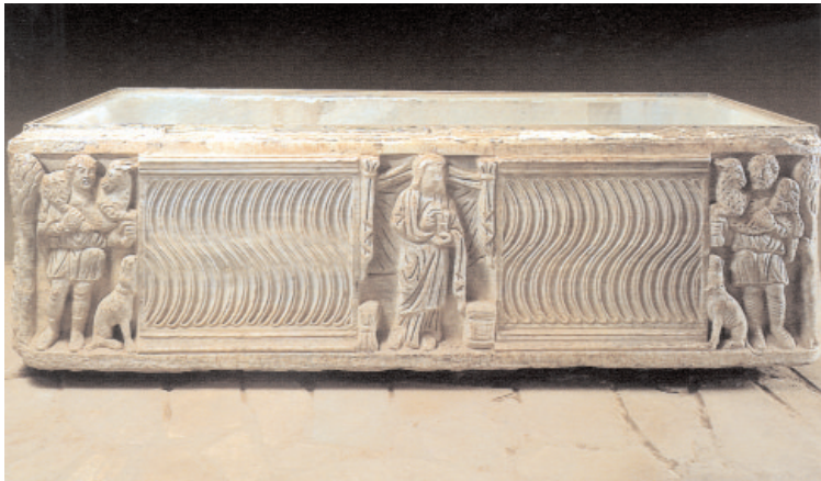
Sepolcro del IV secolo in cui si possono osservare due rappresentazioni del Buon Pastore.

dalle mura della città. Non seppellirai l'uomo morto né lo brucerai nell'Urbe 2 . I romani erano soliti incenerire i corpi dei defunti ma esistevano anche alcune famiglie che avevano la consuetudine di interrare i propri cari in campi di loro proprietà, consuetudine che si andò imponendo in seguito per influenza del cristianesimo.