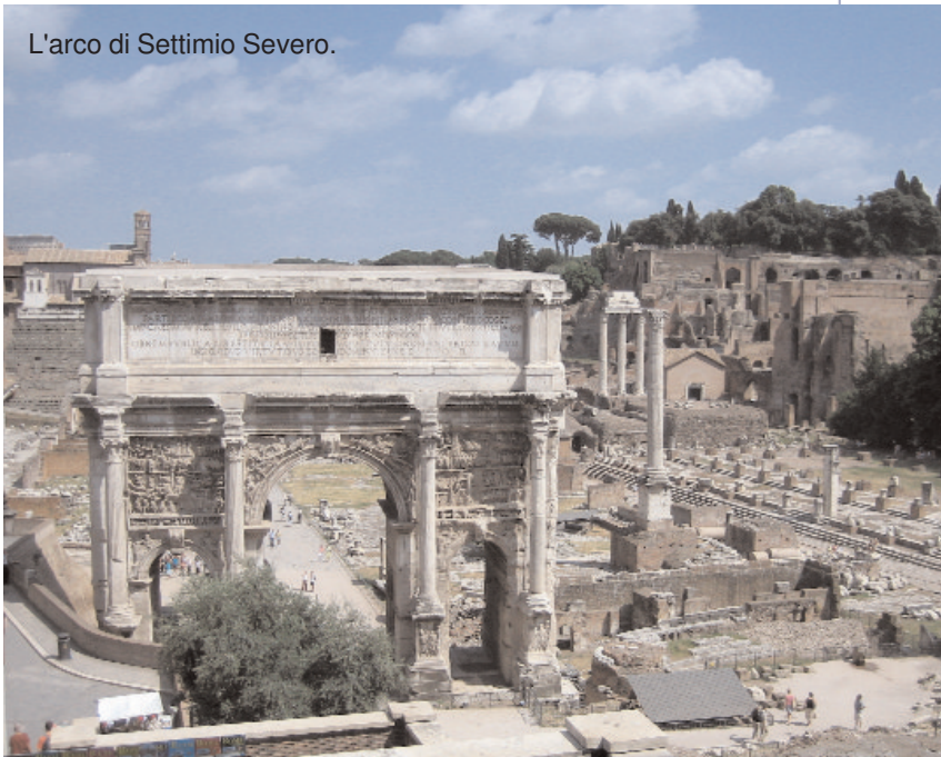
L'arco di Settimio Severo.

struì un altro in onore della sua sposa Faustina; e Magenzio ne edificò un terzo per ricordare il suo figlio Romolo.